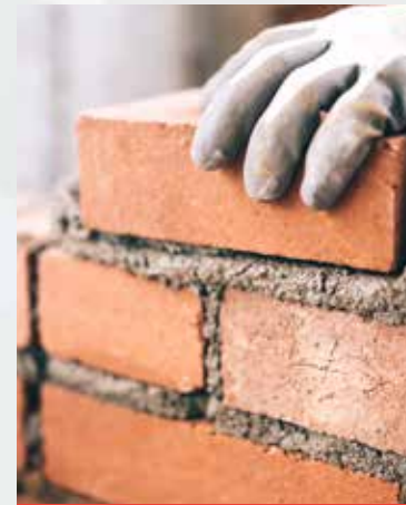
Pegado de piezas