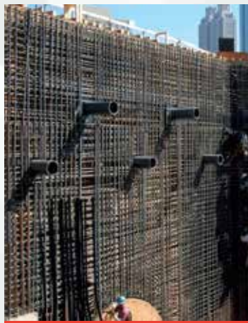
Elementos densamente armados